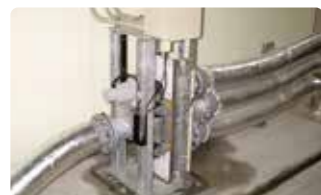
⑨ ラインチェンジャー 自動でエアー搬送ラインを切替。直列切替方式で閉塞の心配がありません。2～5分岐まで可能です。