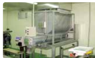
⑫ 氷定量搬出装置 一定量を数秒間隔で投入することができます。出荷水詰め等に最適です。