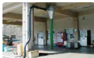
⑩ サイクロンレシーバー エアー搬送で運ばれた氷の高速噴射を回転で抑え、下へ自由落下させます。