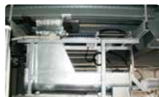
⑤ 計量スクリューコンベア 氷を搬出しながら連続で計量するため、搬出時間を短縮。30kg～60ton/hの計量が可能です。

アイスマンの氷貯蔵搬送には、様々なオプション装置があります。用途に応じ、最適な装置を組み合わせ、使いやすい最適システムをご提案致します。