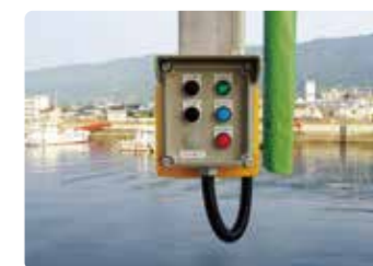
遠方操作スイッチ 氷販売機と出水場所が離れているとき、遠方操作スイッチにて出氷・停止操作が可能となります。