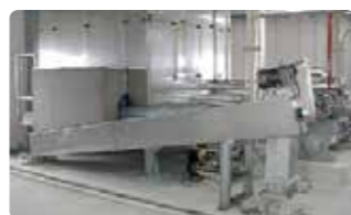
⑦ スクリューコンベア 比較的短い距離の水搬送に適しています。必要搬送能力に対して、最適なものを選定できます。