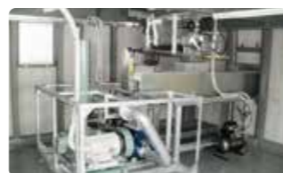
⑧ エアー搬送システム プレート氷を空気で移送するため長距離輸送が可能です。