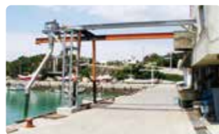
⑪ 船積タワー 岸壁に設置し、船への積み込みがスムーズです。ホースの上下・旋回も可能です。