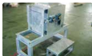
⑥ 二次砕氷機 10mm角程度までの砕氷が可能です。氷のサイズ及び処理能力は、必要に応じて選定できます。