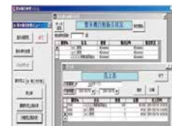
POSシステム 氷自動販売用に開発した専用のPOSシステム。漁協の販売と連携して、一日の利用状況、月別の集計、各会員様の集計などを行うことができます。